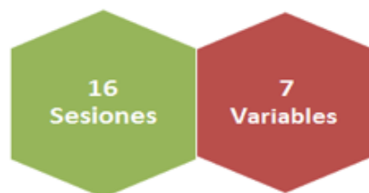
Modelo de educación basado en las competencias de la Reforma Penal

Parte del material didáctico que se provee a las escuelas de derecho está conformado por tres manuales que sirven como libros de texto. Los manuales abordan temas del proceso penal acusatorio, técnicas de litigación oral y métodos alternos a la solución de controversias, y salidas alternas al sistema penal acusatorio; es decir, son los temas que se requieren para incorporar el estudio de los cambios en la reforma procesal penal.